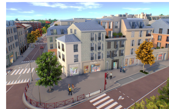
L'îlot Voltaire vu depuis le parvis du Château de l'Amiral (projet dans sa dernière version, en mars 2019 ; architecte : CoBe)

L'îlot Voltaire, du fait de sa centralité, a beaucoup évolué avec les années. Rasé pour élargir la rue et pour réduire l'insalubrité, il est devenu un parking peu esthétique et retrouve, avec ce projet, le rôle structurant dans l'aménagement de la place du Général-de-Gaulle qu'il avait jadis.